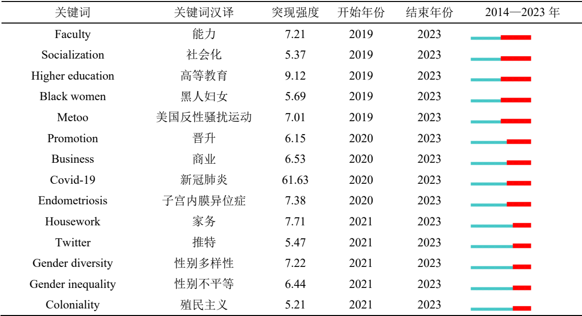
表 58-3 2019—2023 年妇女研究领域关键词突现情况

从突现词的时间演进与发展趋势看，2019 年，Socialization（社会化）、Higher education（高等教育）、Black women（黑人妇女）、Metoo（美国反性骚扰运动）迅速受到学者们的关注。2020 年，COVID-19（新冠肺炎）以极高的强度开始突现。同时，Promotion（晋升）、Business（商业）、Endometriosis（子宫内膜异位症）等相关主题迅速发展。另外，Housework（家务）、Twitter（推特）、Gender diversity（性别多样性）、Gender inequality（性别不平等）、Coloniality（殖民主义）等一系列主题引起了科学家们的热烈讨论，这些主题仍是今后的前沿主题。